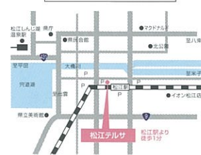
会場までのご案内図

出展メーカー ◆ 清酒メーカー 35社 ◆ 焼酎メーカー 42社 ◆ 洋酒メーカー 13社 ◆ ビールメーカー 5社 ◆ 食品メーカー 14社 ※酒類の試飲もごさいますので、ご来場の際は公共交通機関をご利用ください。 ※お車を運転される方、20歳未満の方の酒類の試飲はご遠慮願います。